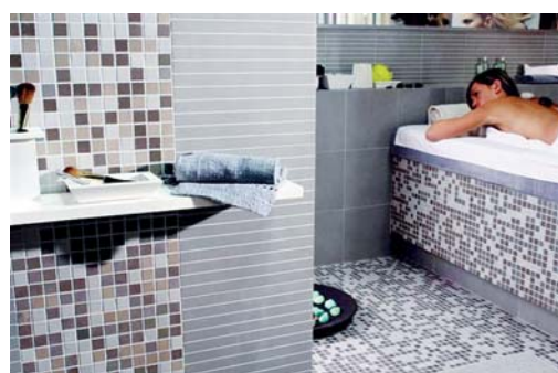
„Back to the rules“ - auch kleine Fliesen sind wieder stark im Kommen.