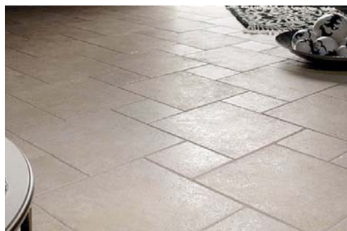
Bodenfliesen höchster Qualität in erdigen Farben liegen voll im Trend.

Puristisches, klares Weiß im Kontrast zu Grau und Schwarz - der Klassiker im modernen Bad.