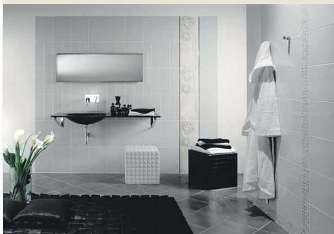
Sachlich, nüchtern, praktisch - das „Black & White“ -Bad für echte Funktionalisten.

Aber auch die Farben sprechen eine deutliche Sprache: Mit Italien verbinden viele Menschen bestimmte Blau-Töne, die an das Meer erinnern.