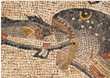
Schon im alten Rom waren Tiermotive bei den Mosaiken äußerst beliebt.

Inszenieren Sie Ihr Bad - in Ihrem ganz persönlichen Stil